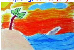
Pantai, Sasa (2B)